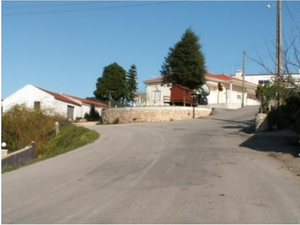
Foto: De Y-splitsing met links de Rua do Rochio